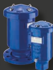
Luftningsventiler VM6126 och VM6128 från CSA