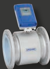
Flödesmätare VM9028 Waterflux från Krohne

Du ska ha lika stort förtroende för oss. Flödesmästarna.