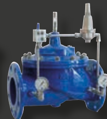
Vattenhydraulisk kontrollventil VM7695 från CSA