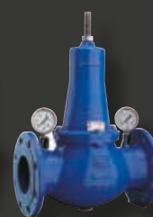
Tryckreducerings- ventil VM7690 från CSA