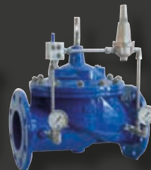
Vattenhydraulisk kontrollventil VM 7695 från CSA